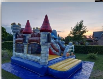
Hüpfburg für 10 Kinder