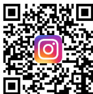
EFA auf Instagramm