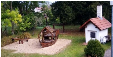
Hof mit Backofen