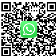
EFA Whatsapp Kanal